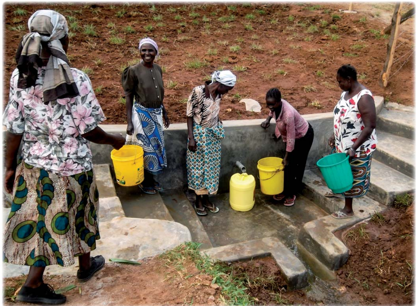
Skyddade vattenkällor i Kenya.

Sex Rotaryklubbar i Rotarys distrikt 2360 har sedan 2005 arbetat med att finansiera byggandet av 33 skyddade källor i sydvästra Kenya i samarbete med Rotarys Läkarbank. Det innebär att de som bor i dessa 33 byar har fått tillgång till rent dricksvatten. Byarna har en samlad befolkning på cirka 45 000 människor, eller nästan lika många som bor i Uddevalla kommun.